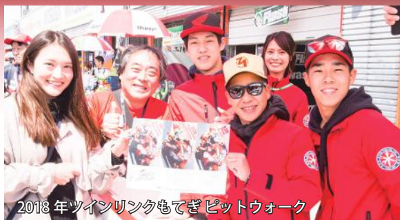
2018年ツインリンクもてぎピットウォーク

サーキットではレースを観戦するだけではなく、もっとライダーやマシンに近いところまで行ける方法があります。 一般的には、「ピットウォーク」とか、「パドックパス」と呼ばれていて、多くの場合は別料金になります。