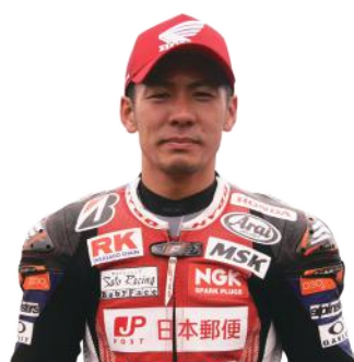
#420 岩田 悟 Satoru Iwata